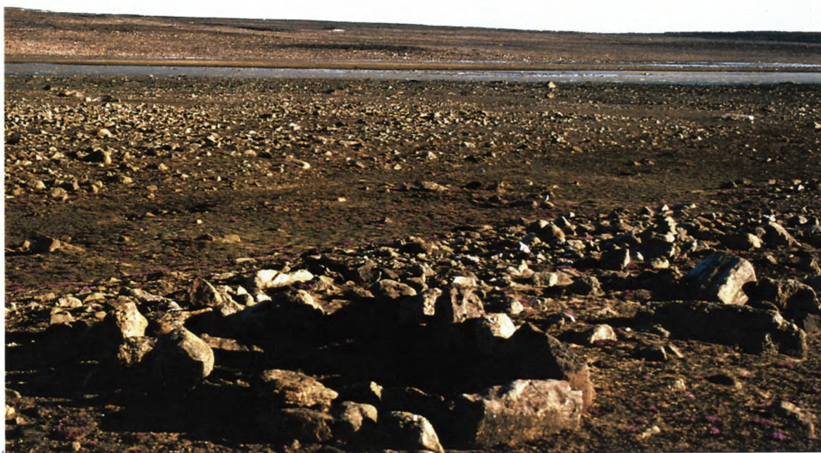
6. Enkelt stensætning.