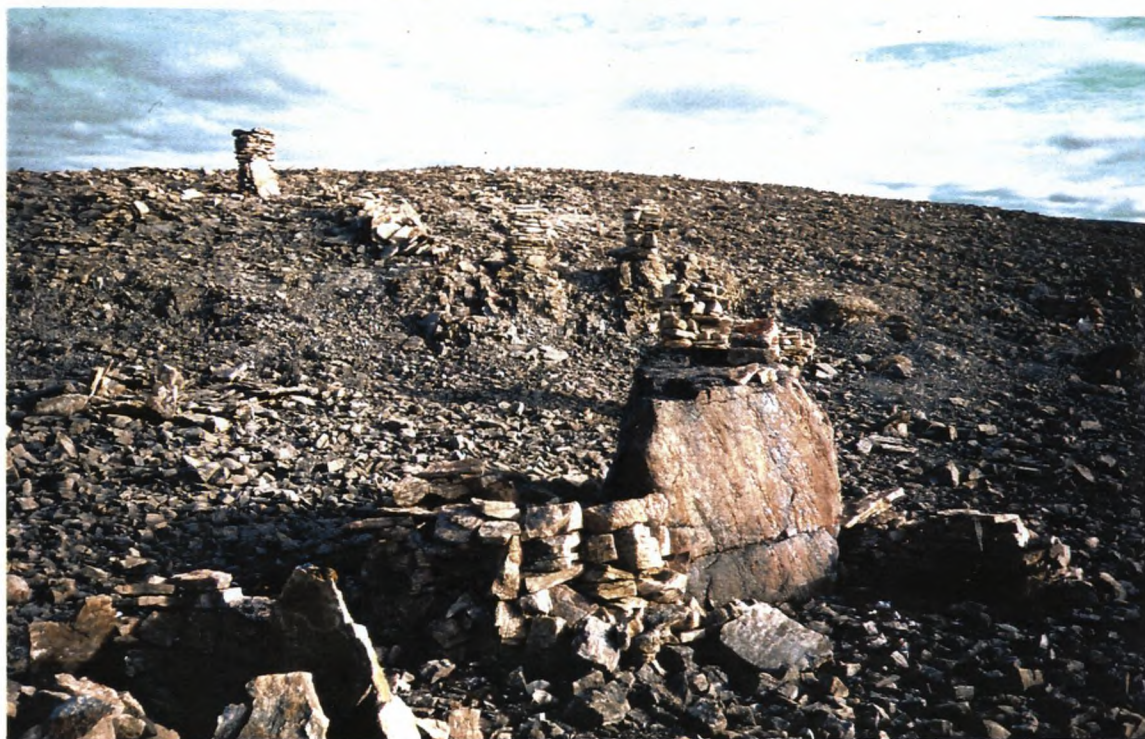
12. Samme som 11.