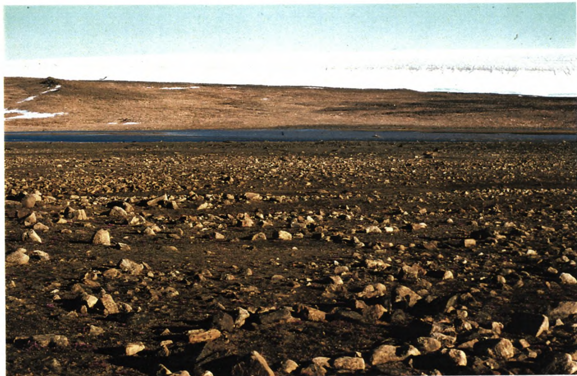
1. Oversigtsbillede, blik mod syd. Tufts Elv og indlandsisen i baggrunden.