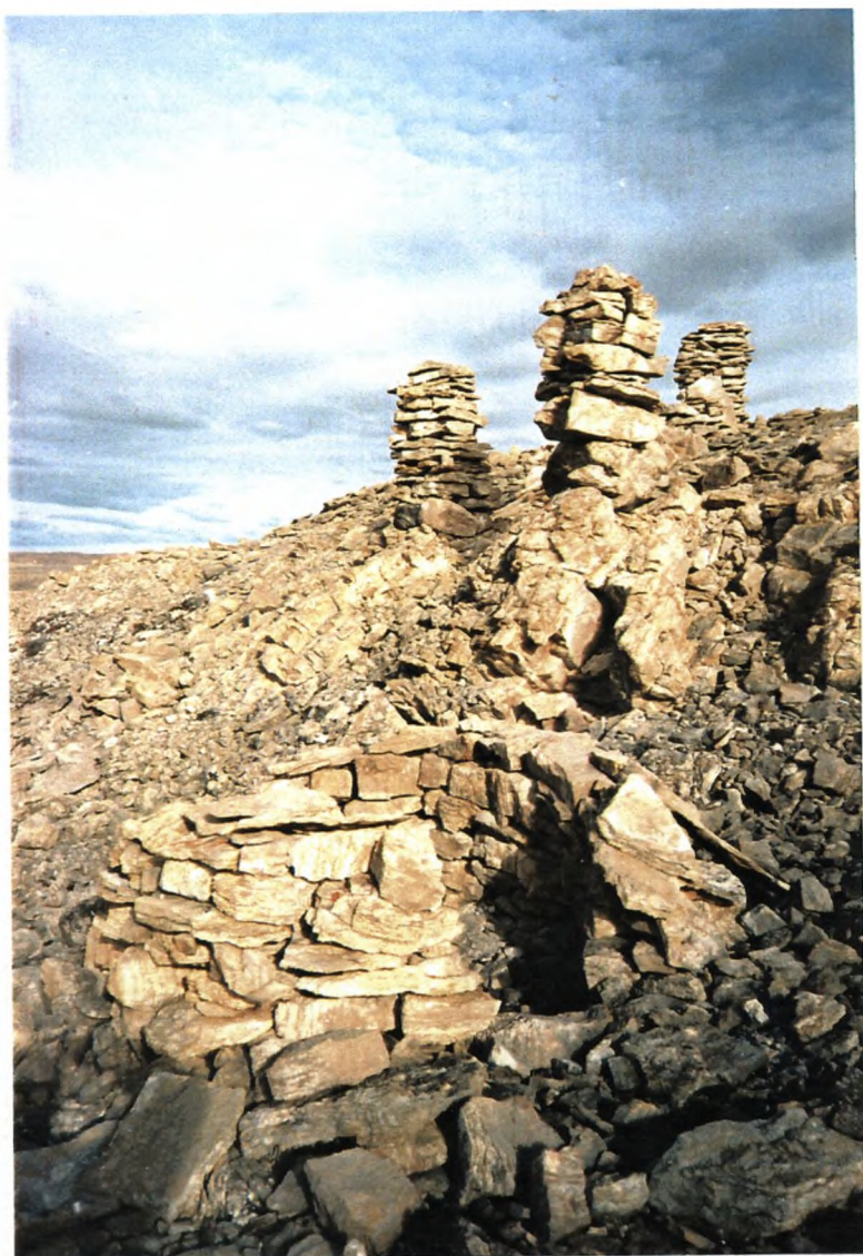
15. Husruin og stentårne.