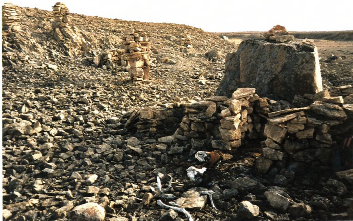
13. Samme husruiner som 11 og 12, med moskusoksekranier og rensdyrtakker.