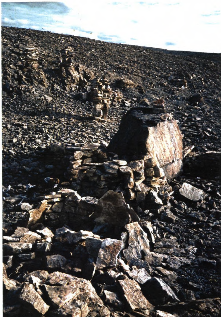
11. Husruiner og stentårne set mod SØ.