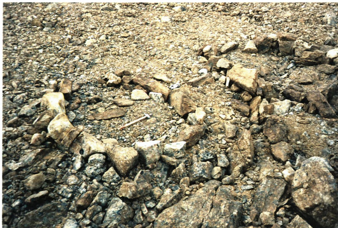
8. Teltringe; hammeren er 45 cm. lang.