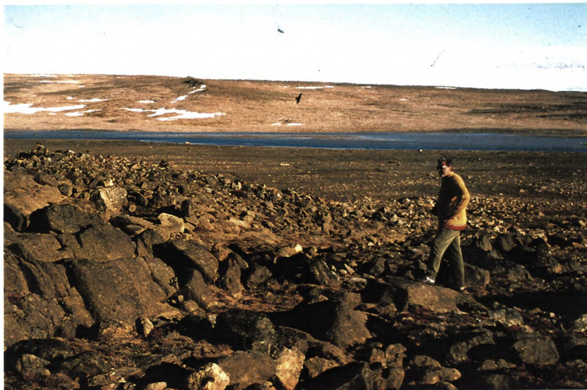
5. Stensætning mod fast klippe.