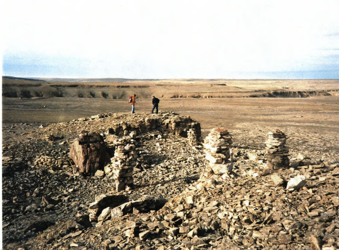
10. Oversigtsbillede, blik mod NV. Arqioq Elv canyon i baggrunden.