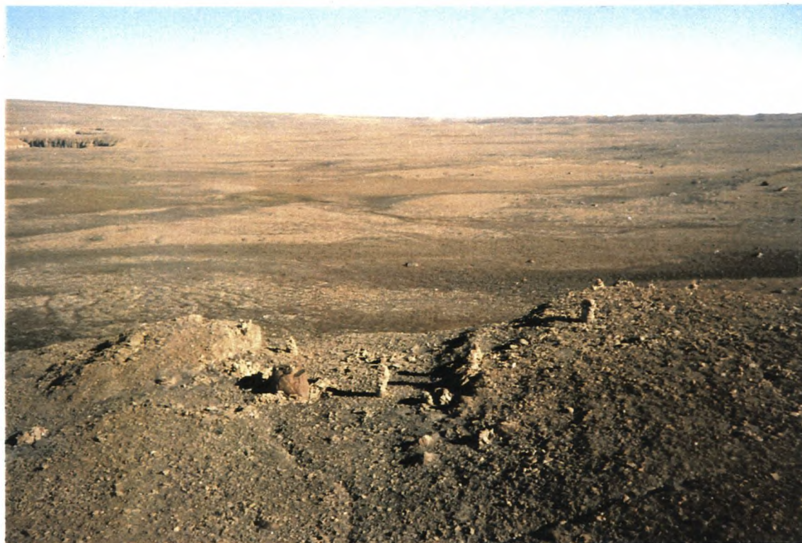
9. Oversigtsbillede fra luften. Blik mod NØ.