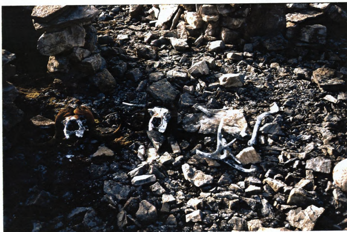
14. Nærbillede af knoglerne fra 13.